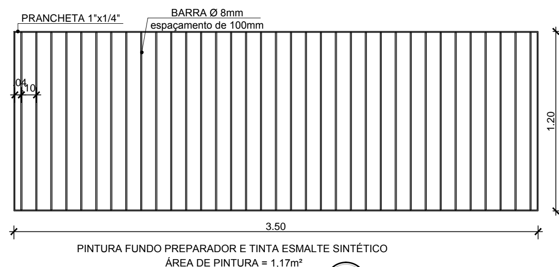
02 DETALHAMENTO 02 ESC: 1/25